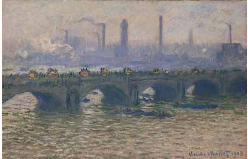
Claude Monet Waterloo Bridge, gråvejrs . 1903 ORDRUPGAARD. KØBENHAVN