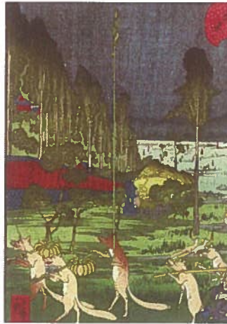
Utagawa Hirokage, Lygtemændene i Oji

Ikke mange ved, at de franske impressionister og postimpressionister, som Monet, Degas og Gauguin, hentede inspiration fra japanske træsnit til deres grundlæggende fornyelse af malerkunsten.