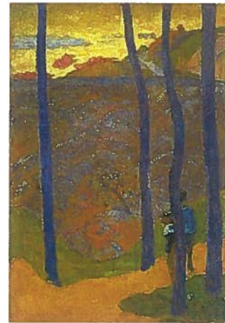
Paul Gauguin, De blå stammer

Gennem særudstillingen har Ordrupgaard belyst og formidlet historien om dette betydningsfulde møde mellem Vesten og Østen. Ordrupgaard præsenterer på denne udstilling mere end 150 træsnit og viser, hvordan den japanske indflydelse kommer til udtryk i værker fra museets egen samling af Manet, Degas, Morisot og Gauguin m.v.